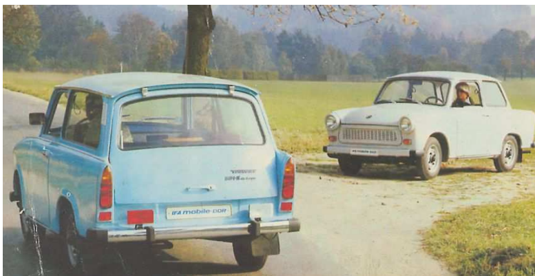
Trabant 601 als Limousine und Universal (1981)

Standard (601), Sonderwunsch(601S) und die Luxusausführung 601 de luxe, welche ab 1978 durch die erweiterte Luxusausführung 601S de luxe ergänzt und später durch sie ersetzt wurde.