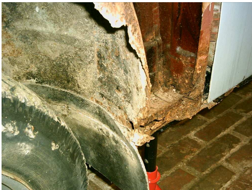
Massive Durchrostungen am Knotenblech Schweller/Geweih/A-Säule (Schraubkante des Vorderkotflügels) und Radschale vorn links nach Demontage des Kunststoffteils

Die unteren Bereiche der A-Säulen sind ebenfalls gefährdet. Nachteilig ist aber, daß diese Bleche doppelwandig ausgeführt sind und man ohne die Demontage des Vorderkotflügels keinen echten Einblick gewinnt, wenn man kein Endoskop zur Hand hat.