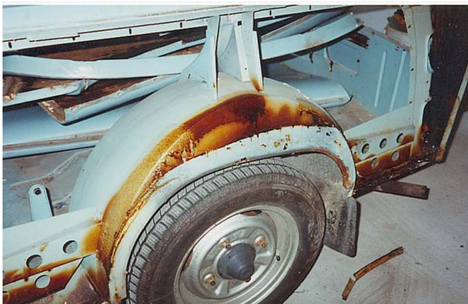
Trabant 601 Universal nach Demontage des linken Hinterkotflügels. Deutlich sichtbar ist die untere, rostgefährdete Kante der Radschale, im oberen Teil sieht man die „Reichweite“ des Konservierungsmittels.

Ein Blick in die Radkästen. Hinter den Duroplastkotflügeln fällt es nicht auf, wenn eine Radschale verfault ist – Problemherd ist die Auflagekante im Radausschnitt. Ab Werk sind die Kunststoffteile hier genietet und mit Zweikomponentenkleber abgedichtet. Die unteren Zentimeter von Radschale (Blech) und Kotflügel (Duroplast) liegen aber werksseitig so aufeinander, daß sich keine Dichtmasse dazwischen befindet. Wasser und Schmutz dringen hier ein und die Radschale fängt von der Kante her an zu rosten. Völlig unbemerkt hinter der Kunststofftarnung. Am besten festzustellen ist ein solcher Schaden durch Abtasten mit der Hand oder durch Sichtprüfung mit einem Handspiegel – vorzugsweise bei demontierten Rädern.