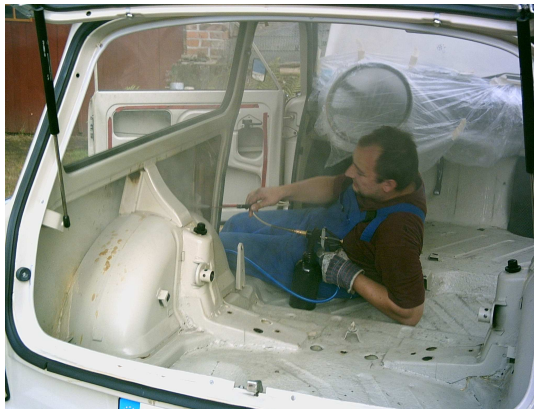
Hohlraumkonservierung eines Trabant 601 Universal mit Korrosionsschutzfett

mit modernen Korrosionsschutzfetten o.ä. Mitteln vorzunehmen bzw. vom Fachmann vornehmen zu lassen. Die dadurch entstehenden Kosten von wenigen Hundert Euro sind zu vernachlässigen, wenn man sie mit dem hohen finanziellen Aufwand vergleicht, den Karosserie-Blecharbeiten und eine Lackierung verursachen. Ganz zu schweigen vom Montageaufwand und der Zeit, die solche Karosseriebau-Arbeiten vorher und hinterher erfordern. Hinzu kommt, daß moderne Korrosionsschutzfette nur einmal angewendet werden müssen und dann dauerhaft schützen. Die jedesmal wieder aufwendige und kostenintensive Nachkonservierung fällt damit weg, was langfristig auch den Geldbeutel schont.