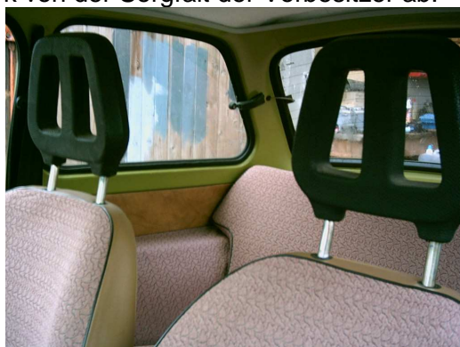
Intaktes Interieur einer Trabant 601S de luxe Limousine (1988)

Häufig wurden von Erstbesitzern mehrere Lagen Schonbezüge übereinandergezogen. Wer ein solches Exemplar ergattert, kann selbst frühe Modelle mit völlig intakten Polstern vorfinden. Auch hier ist es eine Sache von Glück und hängt stark von der Sorgfalt der Vorbesitzer ab.