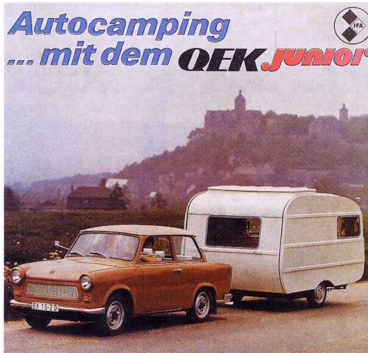
Trabant 601 de luxe mit Wohnwagen QEKjunior

Wer einen wirklichen Oldtimer mit Anspruch auf Originalität haben will, dem sei dringendst empfohlen, beim Kauf einen erfahrenen Kenner des Trabant-Originalbereiches mitzunehmen. Für Anfänger ist es fast unmöglich, mit Sicherheit zu erkennen ob das Fahrzeug nach- und umgerüstet wurde.