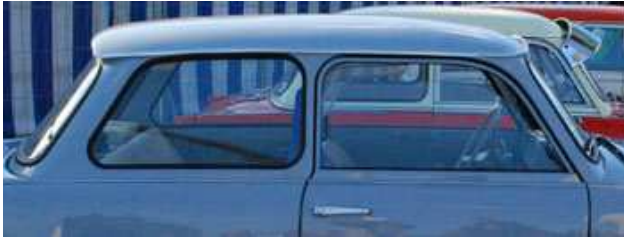
B-Säule schmal (bis Februar 1984)

Außerdem gibt es karosserieeitig einige ganz eindeutige technische Merkmale. Eine schraubengefederte Hinterachse z.B. kann nicht zu einem angeblich originalen Baujahr vor 1988 gehören, da sie erst im April 1988 serienmäßig eingeführt wurde. Die breite B-Säule zeugt immer von einem Baujahr ab 1984 oder später – sie wurde erst im Februar 1984 eingeführt, vorher war sie mehrere Zentimeter schmaler. Allerdings gilt das nur für die Limousine – der Kombi behielt die schmale Variante bis zuletzt.